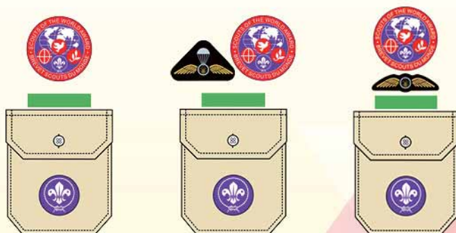
樂行童軍 / 成年成員