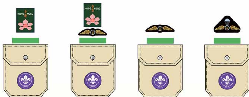
幼童軍 / 童軍