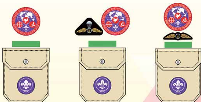
樂行童軍 / 成年成員