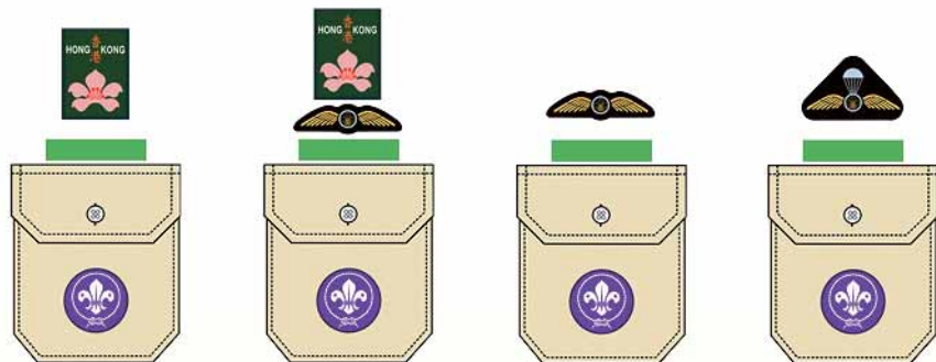
幼童軍 / 童軍