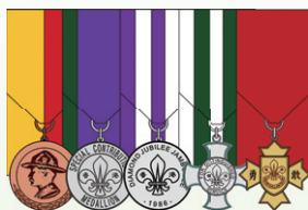
(圖二：四個或以上獎章)